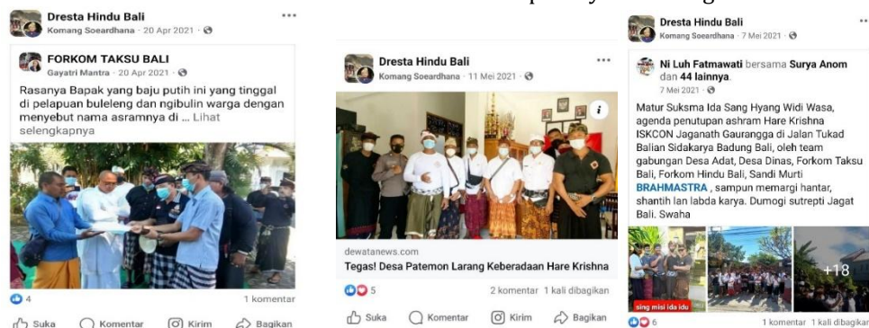
Gambar 3: Aksi mobilisasi massa untuk menolak Sampradaya di berbagai daerah di Bali.

Salah satu kekuatan dari media sosial dalam gerakan aktivisme yang telah terbukti selama ini adalah penggalangan massa di dunia nyata. Ini melibatkan usaha pengorganisasian aksi offline yang disebarluaskan melalui media sosial, seperti protes, demonstrasi, atau pemogokan. Media sosial berperan sebagai alat untuk koordinasi massa dan penyebaran informasi logistik.(Chusna, 2021; Rochmawati et al., 2024). Media sosial sebagai ruang mobilisasi massa bisa dicermati dari unggahan para tokoh Hindu berikut ini.