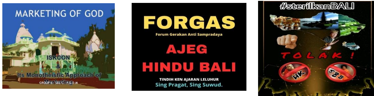
Gambar 4: meme kritis dan satir terhadap kiprah Sampradaya di Bali.

Menyampaikan pesan, membentuk opini, atau sekadar hiburan merupakan karakter khas meme di media sosial dalam mengkritisi fenomena . Secara teori, meme bisa didekati atau menggambarkan tiga komponen, yakni manifestasi ( manifestation ), kebiasaan ( behavior ), dan keidealan(Davison, 2012). Dengan mencermati fenomena meme dan ruang public di media sosial, nampaknya meme Sampradaya dijadikan instrumen kritik bagi para aktivis media sosial yang kontra atas keberadaan Hare Krishna dan Sai Baba. Kritik-kritik yang dibangun bisa dijumpai dari berbagai jenis meme di media sosial. Meme tersebut penulis rangkum sebagai berikut.