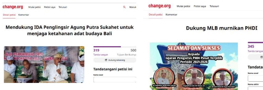
Gambar 2. Petisi yang dilakukan oleh kelompok penentang Sampradaya pada situs change.org

Penolakan terhadap Sampradaya Hare Krishna dan Sai Baba dapat dicermati dari petisi online yang disebarlauskan di kanal-kanal media sosial yang dimuat pada situs charge.org.