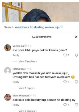
Gambar 3. Konten “Banyak Brand yang Produknya Overclaim? Masa Sih?”