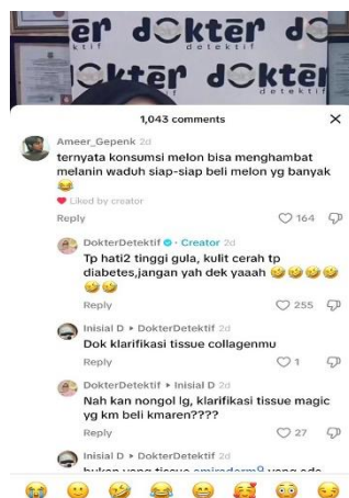
Gambar 6. Konten Battle Brand 2 Dokter

Hal berkelanjutan yang dilakukan oleh dokter kepada netizen di penelitian ini dengan menjaga hubungan yang terjalin dengan tetap aktif berinteraksi melalui kolom komentar. Seperti pada postingan konten tanggal 4/12 yang mendapatkan jumlah like sebanyak 14,6ribu dengan highlight “BATTLE BRAND 2 DOKTER” di dalam komentar terlihat dokter berbalas komen dengan akun netizen @Ameer_Gepenk dan @Inisial D seperti pada gambar tersebut