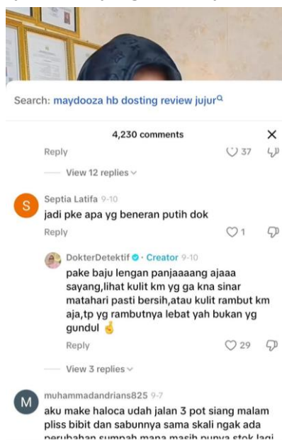
Gambar 4. Konten “Banyak Brand yang Produknya Overclaim? Masa Sih?”