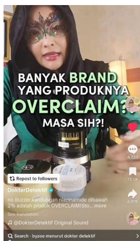
Gambar 2. Konten “Banyak Brand yang Produknya Overclaim ? Masa Sih?”

Dalam kasus Dokter, konteks dikembangkan dengan menyajikan informasi berbasis edukasi produk kecantikan, terutama yang terkait dengan pengujian laboratorium dan penelitian agar konten yang dibagikan menambah kepercayaan publik. Seperti pada konten yang diunggah pada tanggal 7/9 dengan highlight “Banyak Brand yang Produknya Overclaim ? Masa Sih?” dalam konten ini memiliki jumlah like sebanyak 133,2 ribu. Dalam konten ini dokter memberikan edukasi mengenai kandungan niacinimide yang efektif dalam penggunaannya.