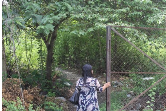
Gambar 3. Petobo

"Oke, waktu itu pas pukul 6 pas ya, magrib, bencana itu datang, saya tsunami, korban tsunami. Pas itu saya ada dalam rumah, iya kan, saya waktu itu hamil, hamilkan P****, anakku itu. Pas keluar jatuh-jatuh, kan goyang, guncangan-guncangan, saya sedang hamil, guncangan kuat, berdiri jatuh, sampe berapa kali berdiri, baru bisa tembus keluar. Waktu itu, untung ada ... kayak orang baikya, mobilnya itu kosong, dia lewat, diangkatlah saya dalam mobil dengan besar perut dibawa lari ke atas gunung, entah air sudah naik, untuk ada orang yang selamatkan. Orang tua, saudara 2, 4 orang (kena tsunami)." (MY)