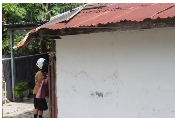
Gambar 6. Besusu Barat

“Apa eh laut itu pe jahat jo, dia yang babunuh sa punya anak, begitu pikirannya saya toh, dia yang bunuh anakku, begitu dalam pikiran, biasa baliat laut, hmm dia lagi yang babunuh anakku, begitu pikiran.” (AT)