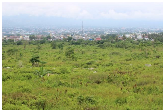
Gambar 4. Balaroa