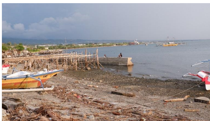
Gambar 2. Pantoloan

“Singkat cerita, dan satu malam itu, di situlah saya banyak hilang-hilang pikiran, bertemu orang bicaranya kaku, bertemu orang berinteraksi tidak mengingat siapa-siapa, dalam artian kalau lihat muka langsung saya kenal, tapi kalau ditanya kamu mau kemana, tidak jelaslah, tidak jelas karna betul-betul fikiran ini fly ... tidak tahu arahnya kemana dan setelah ... berbulan-bulan ... eh minggu ... adik saya dinyatakan, tidak ditemukan dan di situ juga kesehatan mental saya sangat terganggu sampai saat ini, saya cukup merasakan yang namanya kesehatan mental yang terganggu. Nah dampaknya cukup itu saja mungkin untuk sekian pertanyaan apa yang terjadi, ya kami sekeluarga, terutama tiga anggota keluarga yang mengalami langsung, kita terkena tsunami waktu tsunami di kota Palu 2018.” (MR)