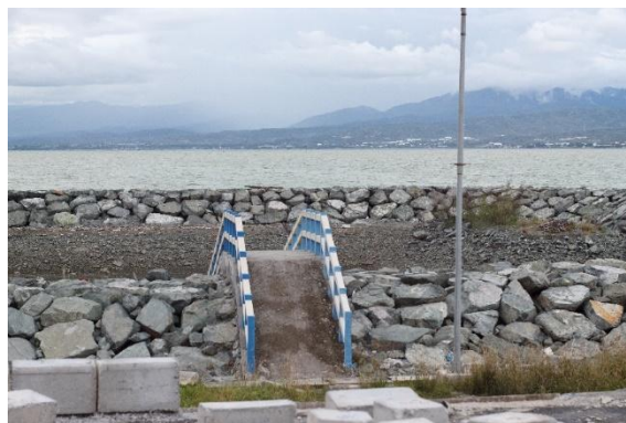
Gambar 5. Pantai Taman Ria