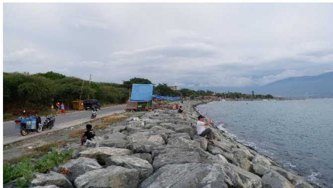
Gambar 1. Kampung Nelayan