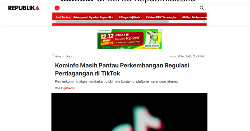
Gambar 3. Berita Republika.co.id

Berdasarkan hasil analisis yang telah dilaksanakan republika.co.id mempunyai frame yang berbeda dengan cnnindonesia.com, dimana republika.co.id memiliki beberapa frame yang berbeda dalam memberitakan isu penutupan TikTok Shop di Indonesia. Seperti pada berita tanggal 17 September 2023, dimana lebih berfokus kepada pemantauan perkembangan regulasi yang mengatur mengenai perdagangan pada media sosial TikTok.