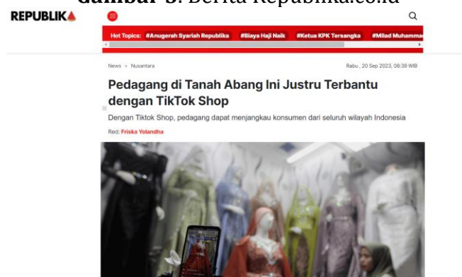
Gambar 5. Berita Republika.co.id

Namun terdapat hal yang berbeda lainnya dalam pemberitaan yang dibuat oleh republika.co.id. dimana pemberitaan republika.co.id terdapat suatu pemberitaan yang cenderung adanya hal positif dari peristiwa yang berhubungan TikTok Shop. Dimana seperti pemberitaan pada tanggal 20 September 2023., yang berfokus bahwa adanya pedagang tanah abang yang justru merasa terbantu dengan adanya TikTok Shop. Karena bagi pedagang tersebut TikTok Shop membantu mereka dalam menjangkau pembeli yang berasal dari seluruh wilayah yang ada di tanah air tanpa adanya musim-musim tertentu.