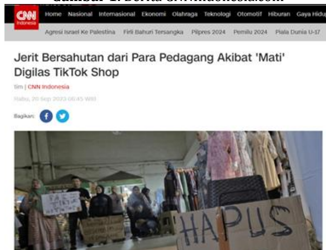
Gambar 1. Berita CNNIndonesia.com