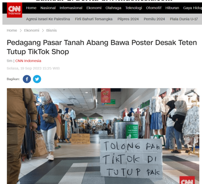
Gambar 2. Berita CNNIndonesia.com