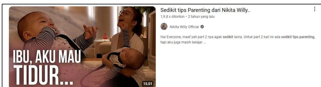
Gambar 2. Sedikit tips Parenting dari Nikita Willy