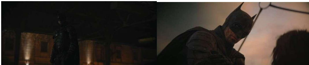
Gambar 14. Sikap Batman dalam Menolong Korbannya

Perubahan dalam respons korban mencerminkan bagaimana Batman berhasil mengubah makna dari sosok yang telah ia ciptakan. Awalnya, respons korban terjadi ketakutan setelah menerima pertolongan dari Batman, karena kesan intimidasi yang diberikan oleh Batman membuat korban merasa terancam. Sosok Batman yang memiliki elemen intimidasi merupakan salah satu dimensi karakteristik dari kekerasan, khususnya kekerasan psikologis menurut Galtung seperti yang disebutkan dalam penelitian Nasrin & Pithaloka (2022). Namun, pada akhir film, kesan intimidasi tersebut menghilang, dan korban yang diselamatkan oleh Batman justru ingin berterima kasih kepadanya. Korban yang mendapat pertolongan merasa kedekatan secara emosional karena rasa takut yang disebarkan kepada Batman hilang dan menjadi harapan untuk menyelamatkannya. Makna pembalasan yang awalnya melekat pada Batman berubah menjadi makna harapan bagi kota Gotham.