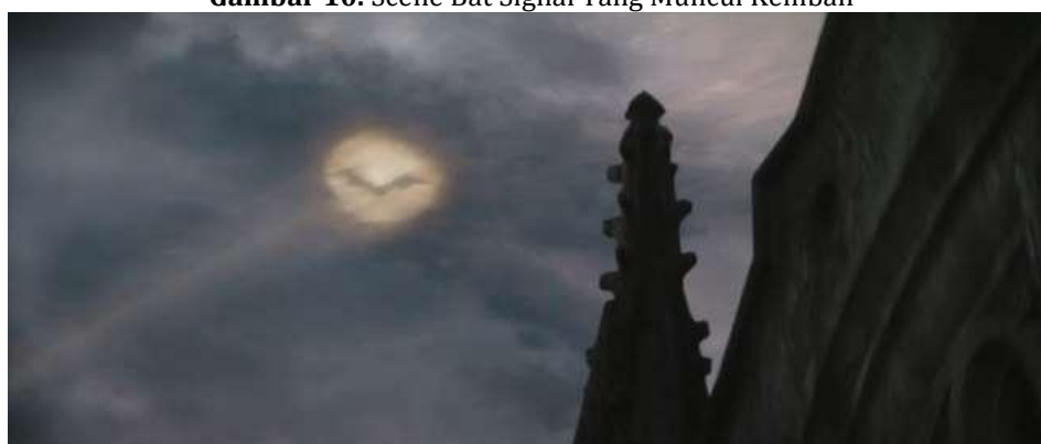
Gambar 10. Scene Bat Signal Yang Muncul Kembali

Mitos: Seseorang yang merasa dendam hanya akan merusak dirinya sendiri. Cara yang mereka pilih untuk melampiaskan dendam bisa berdampak pada lingkungan sekitarnya. Dendam bisa menjadi beban yang menghancurkan diri sendiri, bahkan dapat mengubah kepribadian kita. Oleh karena itu, masyarakat harus memiliki ketahanan emosional yang kuat dan kemampuan untuk tetap berjuang dalam menghadapi tantangan dalam hidup.