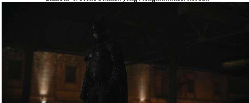
Gambar 4. Scene Batman yang Mengintimidasi Korban