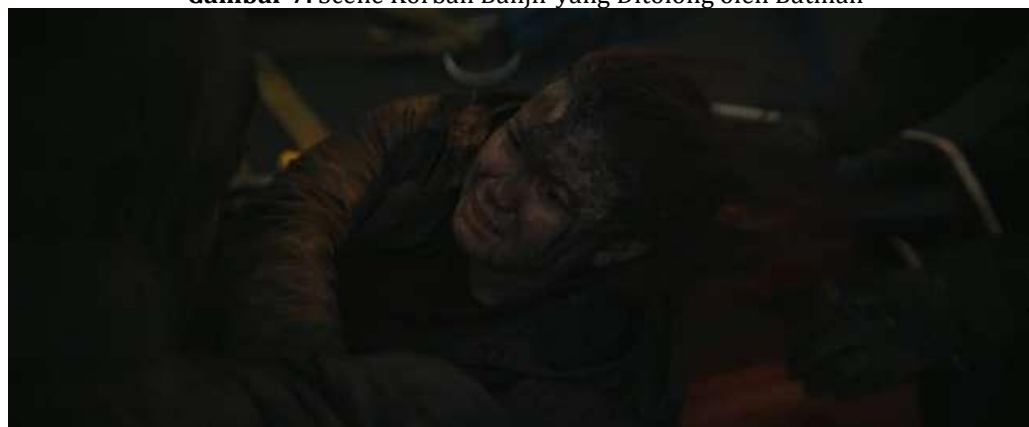
Gambar 7. Scene Korban Banjir yang Ditolong oleh Batman

Mitos: Pada pagi hari biasanya masyarakat akan melakukan kegiatan aktifitasnya. Terlebih saat mereka mendapatkan masalah yang harus diselesaikan, pagi hari adalah momen yang tepat bagi masyarakat untuk memulai harinya.