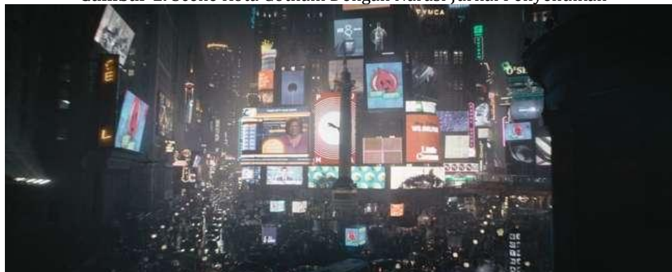
Gambar 1. Scene Kota Gotham Dengan Narasi Jurnal Penyelidikan