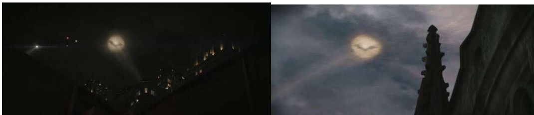
Gambar 12. Kemunculan Bat Signal yang Berbeda Waktu

Dalam adegan pertama, Kota Gotham dilanda hujan dengan gambaran aktivitas malam di tengah kota. Hujan yang turun juga dapat diartikan sebagai simbol kesedihan. Selain melambangkan kesedihan, hujan juga dapat berfungsi untuk menyembunyikan kesedihan seseorang (Qiwarunnisa & Mulyono, 2018). Kesedihan yang dimaksud di sini merujuk pada kerusakan kota Gotham yang disebabkan oleh tingginya tingkat kejahatan. Pada adegan yang menampilkan kota saat matahari terbit menjelang akhir film, hal ini menggambarkan perubahan yang terjadi di kota Gotham. Batman, yang awalnya terlihat sebagai simbol balas dendam, berubah menjadi simbol harapan bagi penduduk Gotham. Warna jingga dan kekuningan yang dominan dalam adegan ini melambangkan bahwa kota Gotham telah menjadi lebih kuat dan hidup (Birren, 2016). Memperlihatkan bagaimana perubahan yang dilakukan oleh Batman membuat kota Gotham ini memiliki harapan untuk berubah dari kota yang busuk dan hancur karena korupsi dan kriminal, menjadi kota yang aman bagi warga Gotham.