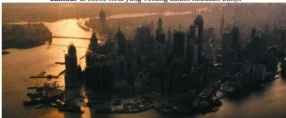
Gambar 6. Scene Kota yang Tenang dalam Keadaan Banjir