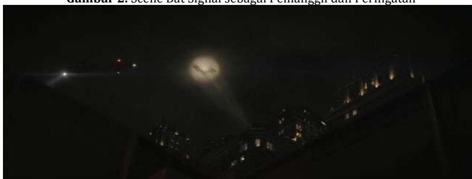
Gambar 2. Scene Bat Signal sebagai Pemanggil dan Peringatan

Mitos: Di tengah keramaian kota memang sering terjadi tindakan kejahatan seperti kekerasan, pencurian, perusakan fasilitas kota dan sebagainya. Mereka memang lebih sering beraksi pada malam hari, karena banyak masyarakat yang sudah tidur dan minim aktifitas pada malam hari. Kota Gotham pun juga terlihat seperti mencekam dan tidak aman untuk aktifitas masyarakat dengan adanya perampok, kekerasan, dan perusakan bangunan.