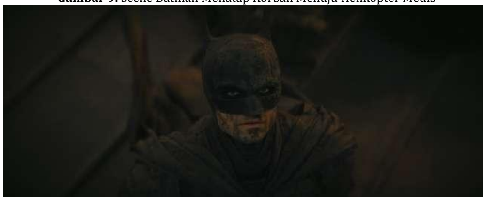
Gambar 9. Scene Batman Menatap Korban Menuju Helikopter Medis

Mitos: Seseorang yang memiliki kekuasaan untuk membantu masyarakat dapat memiliki citra yang berbeda di mata setiap orang. Mereka bisa terlihat arogan, tampak kurang empati, atau bahkan terlihat seperti seseorang yang mengharapkan imbalan atas bantuannya. Namun, banyak masyarakat yang melihat mereka sebagai pahlawan tanpa merasa takut untuk menerima bantuan dari mereka. Sang penolong juga dapat melihat rasa terima kasih dari orang yang dibantunya, serta meresponsnya dengan baik. Tindakan mereka dapat memiliki dampak yang signifikan pada korban dan cara mereka meresponsnya juga penting dalam membangun hubungan yang positif antara penolong dan yang dibantu.