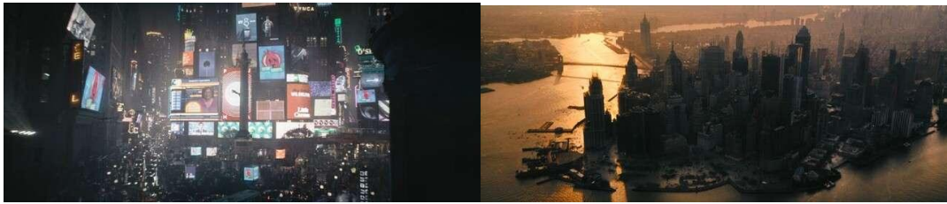
Gambar 11. Penampilan Kota Gotham yang Lebih Hangat

Dalam adegan pertama, Kota Gotham dilanda hujan dengan gambaran aktivitas malam di tengah kota. Hujan yang turun juga dapat diartikan sebagai simbol kesedihan. Selain melambangkan kesedihan, hujan juga dapat berfungsi untuk menyembunyikan kesedihan seseorang (Qiwarunnisa & Mulyono, 2018). Kesedihan yang dimaksud di sini merujuk pada kerusakan kota Gotham yang disebabkan oleh tingginya tingkat kejahatan. Pada adegan yang menampilkan kota saat matahari terbit menjelang akhir film, hal ini menggambarkan perubahan yang terjadi di kota Gotham. Batman, yang awalnya terlihat sebagai simbol balas dendam, berubah menjadi simbol harapan bagi penduduk Gotham. Warna jingga dan kekuningan yang dominan dalam adegan ini melambangkan bahwa kota Gotham telah menjadi lebih kuat dan hidup (Birren, 2016). Memperlihatkan bagaimana perubahan yang dilakukan oleh Batman membuat kota Gotham ini memiliki harapan untuk berubah dari kota yang busuk dan hancur karena korupsi dan kriminal, menjadi kota yang aman bagi warga Gotham.