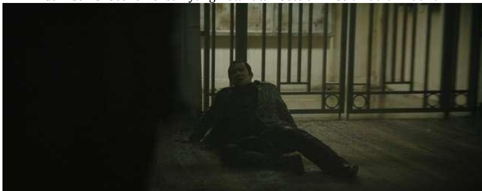
Gambar 3. Scene Korban yang Ketakutan Setelah Diselamatkan Batman

Mitos: Simbol yang diciptakan oleh mereka yang berkuasa memang memiliki kemampuan untuk menciptakan rasa takut di kalangan masyarakat. Sebagai contoh, ketika pihak berwenang patroli menggunakan kendaraan yang dilengkapi dengan simbol dan logo mereka, masyarakat cenderung merasa cemas dan khawatir dengan situasi di sekitarnya. Simbol kelelawar yang digunakan oleh Batman juga berfungsi sebagai representasi takut yang disampaikan secara nonverbal kepada para pelaku kejahatan di kota Gotham. Ini menciptakan citra bahwa sosok Batman sangat menakutkan dalam kegelapan ketika ia berusaha memberantas para penjahat. Di sisi lain, simbol ini juga berfungsi sebagai panggilan bagi pihak berwenang untuk meminta bantuan sang vigilante agar datang ke lokasi tertentu.