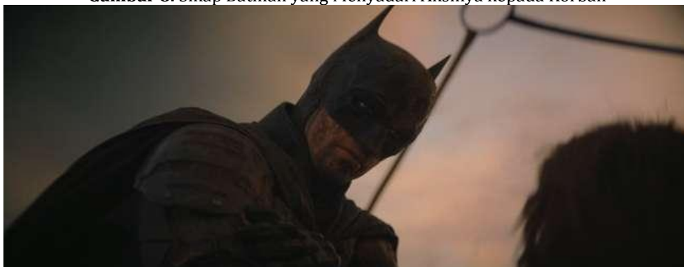
Gambar 8. Sikap Batman yang Menyadari Aksinya kepada Korban

Mitos: Seperti korban bencana lainnya, masyarakat akan berusaha untuk berterima kasih oleh penolongnya. Mereka mendapatkan harapan untuk kesembuhan berkat orang yang ingin menolongnya. Perbuatan tersebut adalah salah satu perilaku terpuji selain meminta maaf dan meminta tolong.