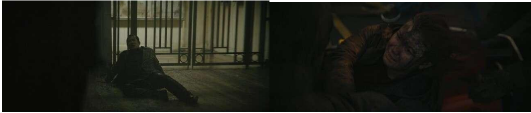
Gambar 13. Respon Korban yang Berbeda Setelah Ditolong Batman

Perubahan dalam respons korban mencerminkan bagaimana Batman berhasil mengubah makna dari sosok yang telah ia ciptakan. Awalnya, respons korban terjadi ketakutan setelah menerima pertolongan dari Batman, karena kesan intimidasi yang diberikan oleh Batman membuat korban merasa terancam. Sosok Batman yang memiliki elemen intimidasi merupakan salah satu dimensi karakteristik dari kekerasan, khususnya kekerasan psikologis menurut Galtung seperti yang disebutkan dalam penelitian Nasrin & Pithaloka (2022). Namun, pada akhir film, kesan intimidasi tersebut menghilang, dan korban yang diselamatkan oleh Batman justru ingin berterima kasih kepadanya. Korban yang mendapat pertolongan merasa kedekatan secara emosional karena rasa takut yang disebarkan kepada Batman hilang dan menjadi harapan untuk menyelamatkannya. Makna pembalasan yang awalnya melekat pada Batman berubah menjadi makna harapan bagi kota Gotham.