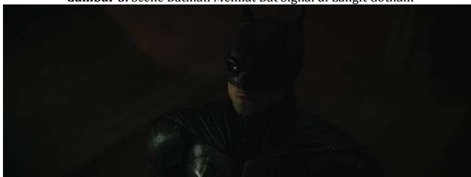
Gambar 5. Scene Batman Melihat Bat Signal di Langit Gotham

Mitos: Sosok yang mengintimidasi membuat orang lain merasakan ketidaknyamanan saat berada didekatnya. Dengan memberikan jarak terhadap pria yang ditolongnya, sang penolong malah tidak memberikan rasa nyaman. Hilangnya rasa empati yang terhadap masyarakat membuat ketidaknyamanan dan rasa takut akan sosok yang harusnya melindungi.