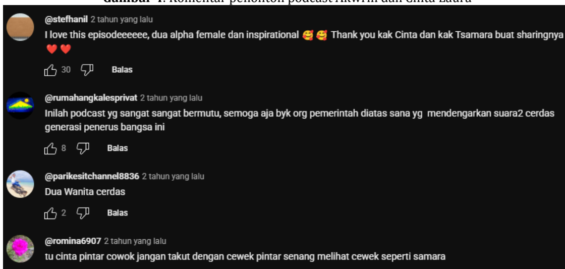
Gambar 4. Komentar penonton podcast Akwrin dan Cinta Laura

“harusnya laki-laki senang dengan perempuan yang begitu karena mereka mencintai tanpa dependensi-dependensi lainnya.”