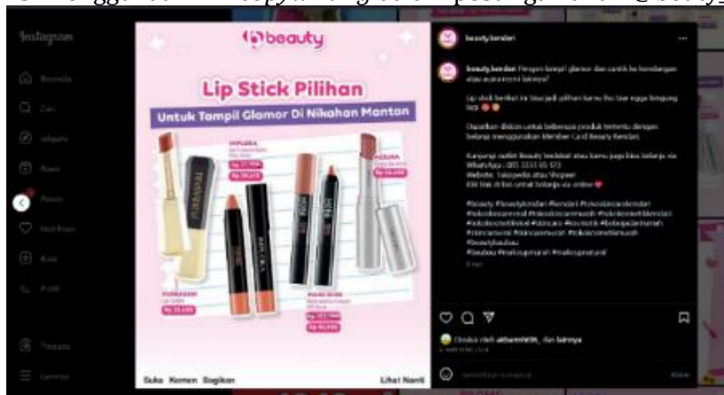
Gambar 3 : Penggunaan mix copywriting dalam postingan akun @beuty_kendari

marketing sisanya beberapa kita menggunakan branding. Jadi sistemnya, direct response tujuannya membuat viral, Marketing tujuannya menjual produk, dan branding tujuannya untuk memperkenalkan identitas Perusahaan". (Dodi Indika, 2023)