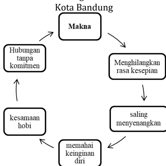
Gambar 4. Bagan Hasil Penelitian Tentang Makna Casual Relationship Bagi Remaja Di Kota Bandung

Bagian ini akan peneliti uraikan terkait riset penelitian terdahulu yaitu dorongan dari perkembangan seksual mendorong remaja untuk mewujudkan dalam perilaku berpacaran yang melampaui batas norma yang ada dalam masyarakat. Bagi remaja di Negara-negara barat hal ini mungkin bukan sesuatu hal yang tabu.namun di Indonesia,perilaku ini menyimpang jika dilakukan oleh remaja dan pasangan yang belum menikah.