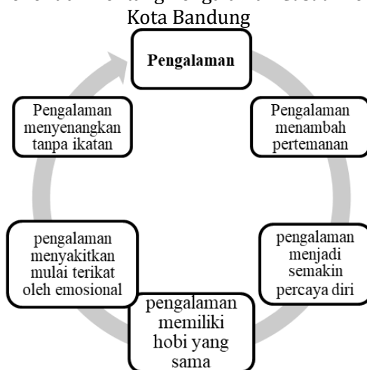
Gambar 3. Bagan Hasil Penelitian Tentang Pengalaman Casual Relationship Bagi Remaja Di Kota Bandung