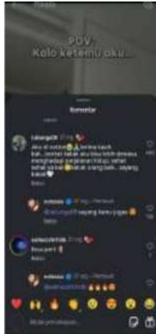
Gambar 3. Interaksi Audiens di kolom komentar