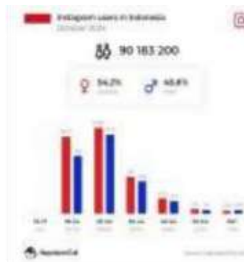
Gambar 1. Data Pengguna Instagram Indonesia 2024

Bagi perempuan, media sosial menyediakan ruang alternatif untuk menegosiasikan identitas, membangun kepercayaan diri, dan mengakses berbagai wacana pengembangan diri yang relevan dengan pengalaman hidup mereka (Lubis et al., 2023). Selain sebagai ruang berekspresi, media sosial juga berperan dalam membentuk identitas personal dan sosial perempuan melalui narasi visual dan pengalaman yang dibagikan secara daring (Shidiqie et al., 2023). Sejumlah studi menunjukkan bahwa perempuan memanfaatkan media sosial untuk memperkuat identitas diri dan membangun kepercayaan diri melalui narasi pengalaman personal yang dibagikan secara daring (Ananda Ade Salsabila, 2025).