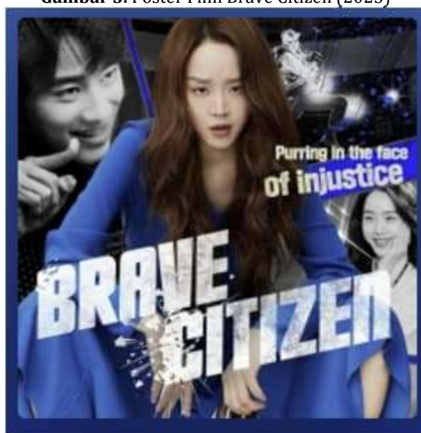
Gambar 3. Poster Film Brave Citizen (2023)