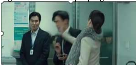
Gambar 7. Adegan Ibu HSk menampar pengacara Lee di ruang guru

Adegan 3 tentang kekerasan yang dilakukan ibu perundung setelah perbuatan anaknya diberitakan media. Merepresentasikan respons agresif pihak berkuasa terhadap pengungkapan kasus. Adanya kekuasaan simbolik melalui bahasa hukum dan eskalasi kekerasan verbal dan simbolik dalam institusi pendidikan