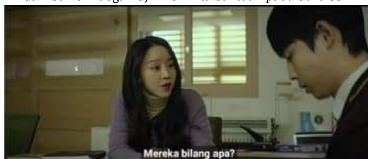
Gambar 6. Adegan Gjh meminta bantuan pada Guru SSm

Adegan 2 menampilkan siswa korban perundungan yang meminta bantuan kepada SSm, guru paruh waktu. Adegan dan dialog merepresentasikan normalisasi pembiaran institusional serta ketidakberdayaan struktural guru paruh waktu. Selain itu, juga menegaskan posisi korban yang terdesak dalam sistem yang cenderung melindungi pelaku.