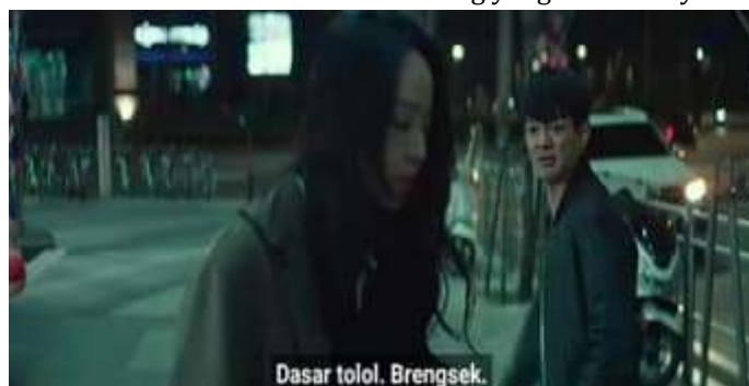
Gambar 8. SSm dimaki oleh orang yang ditabraknya