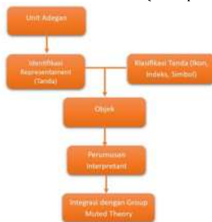
Gambar 1. Skema Analisis (Konseptual)

Proses analisis pada film dilakukan melalui lima tahapan berikut: (1) Identifikasi representamen (tanda) dengan menginventarisasi elemen visual dan verbal dalam adegan yang berfungsi sebagai tanda, meliputi dialog dan keseluruhan adegan. Tahap ini bersifat deskriptif untuk menentukan unit analisis; (2) Klasifikasi jenis tanda dengan mengategorikan sebagai ikon, indeks, atau simbol untuk menjelaskan mekanisme produksi makna dalam teks film; (3) Penentuan objek dengan menganalisis tanda untuk mengidentifikasi realitas atau konsep yang dirujuknya, seperti relasi kuasa, ketidakadilan, marginalisasi, atau keberanian moral; (4) Perumusan interpretant dengan menafsirkan makna yang muncul dari relasi antara tanda dan objek secara kontekstual dan teoretis, hingga diperoleh makna denotatif, konotatif, dan ideologis; (5) Integrasi dengan Muted Group Theory dilakukan dengan menganalisis seluruh temuan semiotik menggunakan perspektif Muted Group Theory untuk mengidentifikasi bentuk-bentuk pembungkaman simbolik, mekanisme dominasi wacana, serta representasi kelompok rentan dalam struktur komunikasi yang timpang. Pada tahap ini, interpretant yang telah dirumuskan dipetakan ke dalam konsep-konsep kunci seperti marginalisasi, pembungkaman, dan dominasi struktural. Dengan demikian, analisis bergerak dari pembacaan tanda menuju kritik struktur komunikasi dan relasi kuasa.