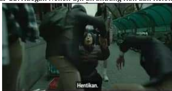
Gambar 13. Adegan Nenek GJh dirundung HSk dan Kelompoknya

Adegan 7 menunjukkan awal mula GJh dirundung (kilas balik) yang merepresentasikan relasi kuasa yang timpang serta normalisasi kekerasan terhadap pihak rentan. Kekerasan simbolik dan fisik bekerja melalui ancaman, penghinaan, dan pemaksaan, sekaligus memperlihatkan kerentanan korban yang terdesak oleh dominasi pelaku dalam ruang publik.