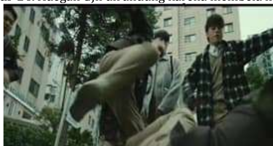
Gambar 14. Adegan GJh dirundung karena membela neneknya