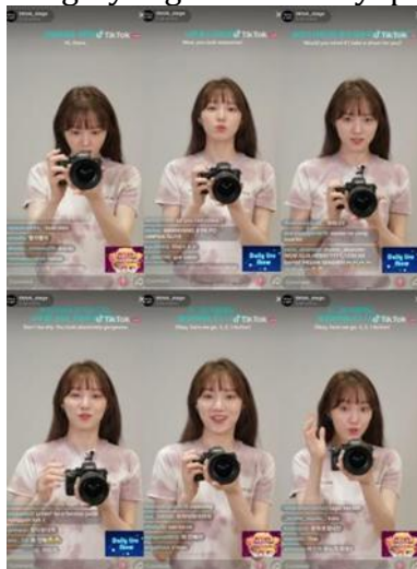
Gambar 2. Lee Sung Kyung ketika menyapa pengemarnya

Kemudian, Lee Sung Kyung memegang kamera DSLR bermerek Sony sembari mengarahkan kamera tersebut untuk bersiap memotret. Dia mengatakan: "Oke, mulai, ya. 3, 2, 1, action!"