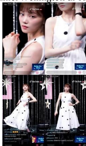
Gambar 5. Iklan Daniel Wellington di TikTok Stage Connect.

Pertunjukan hiburan online seperti fan meeting Le Sung Kyung telah menjadi norma baru di industri musik Korea pada masa Pandemi. Sebelumnya, konser maupun event penggemar adalah sesuatu yang harus kita nikmati secara fisik di suatu tempat, atau jika tidak, orang-orang dapat menontonnya nanti melalui DVD atau blue ray . Selama