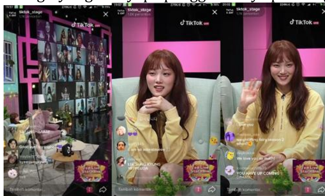
Gambar 3 Lee Sung Kyung menyapa penggemarnya pada segmen penutup.

virtual selama tiga jam, Lee Sung Kyung mengucapkan terima kasih kepada penggemarnya yang sudah mengikuti jumpa penggemar virtual. Kepada para penggemarnya, Lee Sung Kyung meminta maaf karena jarang berinteraksi. Ia juga sangat sedih karena jumpa penggemar ini harus berakhir dan ia sangat mencintai para penggemarnya.