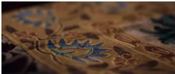
Gambar 8. Air mata di ujung sajadah

Denotasi: tetesan air mata Aqila jatuh di ujung sajadah.