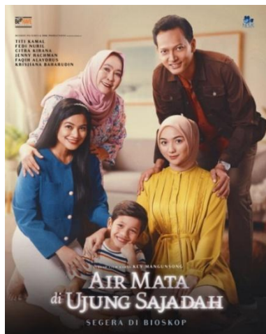
Gambar 2. Poster Air Mata di Ujung Sajadah

Air Mata Di Ujung Sajadah adalah film bergenre drama keluarga Indonesia yang berdurasi 1 jam 45 menit ini dirilis pada tanggal 7 September 2023 yang disutradarai oleh Key Mangunsong berdasarkan skenario yang ditulis oleh Titien Wattimena. Film ini diproduksi oleh Beehave Pictures dan Multi Buana Kreasindo Production dan diproduksi oleh Ronny Irawan dan Nafa Urbach. Aqilla adalah karakter utama film ini yang diperankan oleh aktris ternama Titi Kamal.