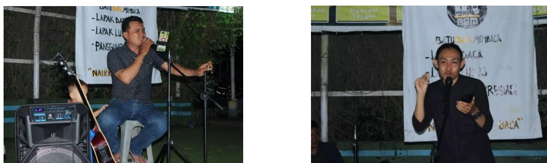
Gambar 2. Lapak Apresiasi

Lapak kedua yaitu lapak Apresiasi. Ini adalah lapak yang disediakan oleh komunitas Batu Bara Membaca untuk Masyarakat yang memiliki minat dalam hal berpuisi, bersyair, berpantun, bahkan bernyanyi. Lapak ini juga sering dijadikan sebagai tempat mengapresiasi suatu kejadian penting atau bahkan menampilkan sesuatu yang menciptakan decap kagum bahkan tepuk tangan.