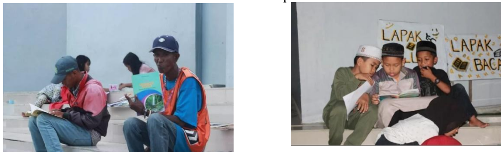
Gambar 1. Gambar Lapak Baca