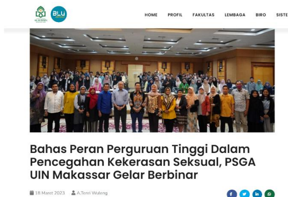
Gambar 1. 1 Sosialisasi melalui website resmi UIN Alauddin Makassar

Anak (PSGA) UIN Alauddin Makassar mendirikan Unit Layanan Terpadu (ULT) pada Oktober 2021 (Takbir et al., 2021). dalam menangani kejahatan seksual. PR juga terus membersamai PSGA agar mengesahkan kebijakan rektor terkait pencegahan kekerasan seksual di kampus. PR juga melibatkan DEMA dan HMJ Fakultas untuk mensosialisasikan secara masif ULT ini saat Pengenalan Budaya Akademik dan Kemahasiswaan (PBAK). Selain itu, media massa pun dilibatkan dalam sosialisasi ini juga memasang pamflet, banner, ataupun membagikan brosur di lingkup universitas. Hal ini sejalan dengan teori Apologia pada unsur membangun iktikad baik ( good-intention ). Satu yang tidak boleh ketinggalan dari pengadaan ULT tetap melibatkan website resmi, facebook UIN Alauddin Makassar, media online , akun instagram dan portal media online media kampus.