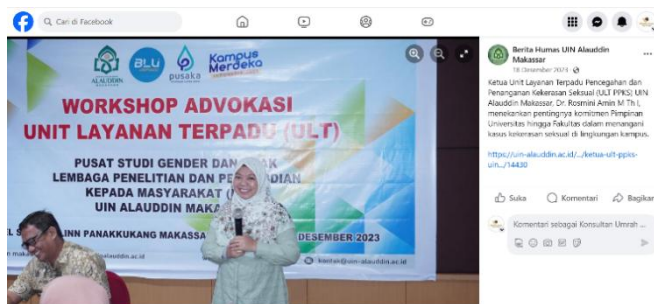
Gambar 1. 2 Sosialisasi melalui Facebook