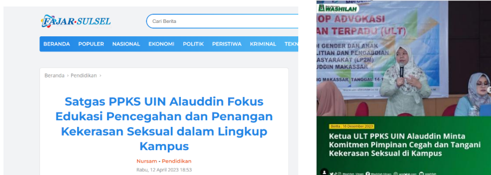
Gambar 1. 3 Sosialisasi Media Massa dan Instagram

Sumber : https://fajar.co.id/ dan @wahilah_uinam