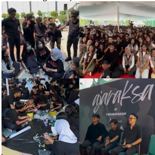
Gambar 2. Program AJARAKSA Pandawara Group