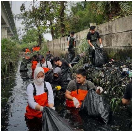
Gambar 1. Program Clean-up Pandawara Group

kegiatan clean up , diharapkan akan terbentuk sikap dan perilaku yang lebih peduli dan bertanggung jawab terhadap lingkungan.