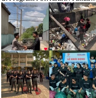
Gambar 3. Program FOR ASEAN Pandawara Group