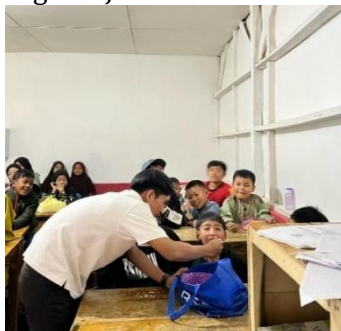
Gambar 4. Program JAGANADARA Pandawara Group