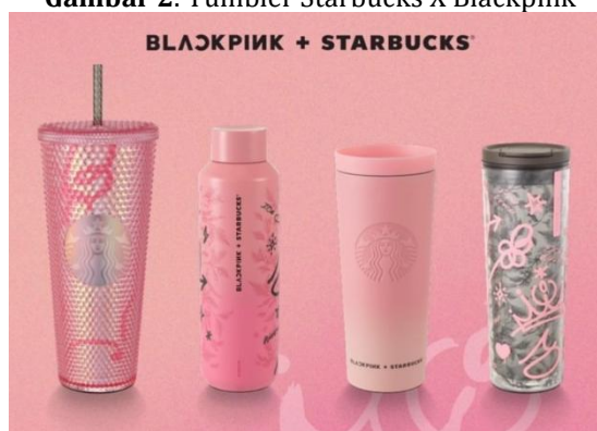
Gambar 2. Tumbler Starbucks X Blackpink

Pada tahun 2023, Starbucks melakukan kolaborasi eksklusif pertamanya di wilayah Asia Pasifik dengan menggandeng artis K-pop , yaitu Blackpink, dengan tema Turn Up Your Summer (Hapsari, 2023). Dinobatkan sebagai girl group terbesar di dunia, Blackpink meraih gelar Entertainer of The Year 2022 dari media ternama yakni TIME (Asih, 2022). Tidak hanya itu, Blackpink juga telah menembus sejarah Youtube dengan menjadi artis musik pertama yang mencapai 80 juta subscribers (Bowenbank, 2022). Oleh karena itu, Starbucks menggaet Blackpink sebagai celebrity endorser karena mengetahui peran dan dampak global yang dimiliki oleh girl group tersebut (Tanudijaya, 2023).