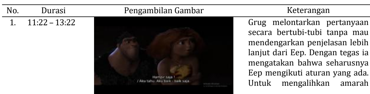
Tabel 1. Potongan Scene Representasi Toxic Masculinity dalam Film The Croods

Penulis akan menyajikan hasil penelitian dengan memaparkan setiap potongan scene yang telah ditentukan pada unit analisis penelitian. Hal ini bertujuan untuk mengetahui bagaimana film The Croods merepresentasikan toxic masculinity dengan berfokus pada satu tokoh yaitu Grug sebab memiliki tanda dari nilai-nilai toxic masculinity . Penelitian dilakukan pada 10 scene film dengan menggunakan fungsi struktur narasi Propp yaitu Prolog ( preparation & complication ), Ideological Content ( transference & struggle ), dan Epilog ( return & recognition ). Selanjutnya, penulis akan mendeskripsikan bentuk verbal maupun nonverbal dari nilai toxic masculinity yang ada pada unit analisis dengan menggunakan kode-kode televisi dari setiap level semiotika John Fiske yaitu level realitas, level representasi, dan level ideologi.