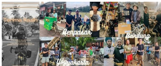
Gambar 2. Para Penerima Dana

Pemilihan orang-orangnya sudah ditentukan sebelum berangkat. Terbagi menjadi dua cara, ada yang secara random sehingga para anggota sama sekali tidak mengenal orang-orang tersebut, ada juga yang sudah pernah ditemui sebelumnya.