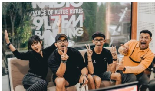
Gambar 4. Sumber Senang di radio Voks

Kemudian masuk ke tahap keempat, yakni umpan balik. Tercapai atau tidaknya tujuan dari program #berbagisenang dapat diketahui melalui tolak ukur keberhasilan yang telah ditentukan sebelumnya oleh para anggota. Fokus dari program ini bukan kepada nominal dana yang terkumpul, melainkan proses saling membantu, dampak positif yang dihasilkan, pencapaian tujuan perjalanan dari Bandung ke Bali, serta dana yang terkumpul dapat tersampaikan dengan lancar.