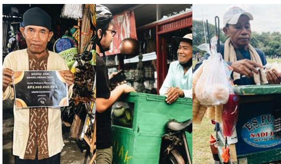
Gambar 1. Penerima Donasi #berbagisenang

Komunitas Sumber Senang merupakan tempat berkumpulnya orang-orang yang gemar bersepeda dengan keinginan untuk memberikan kebahagiaan kepada siapa saja dengan cara bersepeda. Komunitas ini terbentuk pada Juni 2021 dengan berisi 11 orang dari beragam latar belakang di dalamnya. Komunitas ini selain menjadikan bersepeda sebagai hobi para anggotanya juga sebagai media atau perantara untuk bisa memperlihatkan bentuk kepedulian mereka terhadap pedagang bersepeda, yaitu dengan kampanye #berbagisenang (Dirgantara, 2022). Awal mula kampanye itu terbentuk adalah ketika para anggota sedang bersepeda, mereka bertemu dengan pedagang bersepeda. Setelah itu muncul ide untuk merencanakan sebuah gerakan dengan judul "Berbagi Senang untuk Pedagang Bersepeda". Melalui gerakan ini, para anggota komunitas Sumber Senang berkeinginan untuk menyebarkan kebahagiaan kepada para pedagang bersepeda, seperti penjual sayuran, tahu, kopi, dan lainnya. Para anggota juga berharap gerakan ini dapat menjadi wadah untuk mengumpulkan bantuan keuangan dari masyarakat.