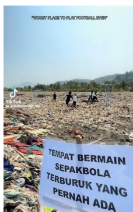
Gambar 3. Konten “Tempat bermain sepakbola terburuk yang pernah ada”