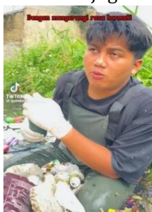
Gambar 2. Konten “Baru juga minal aidzin-an”