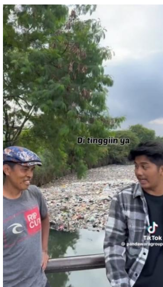
Gambar 4. Konten “Ada lautan sampah, dan diluar kapasitas Pandawara”