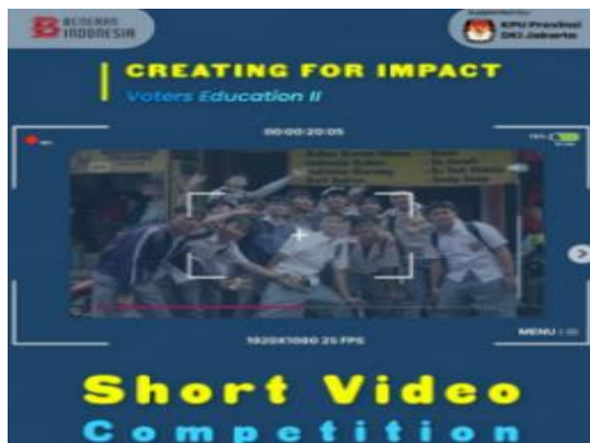
Gambar 1. Konten kolaborasi KPU DKI Jakarta dan Beneran Indonesia

peluang yang lebih besar untuk pesan komunikasinya diterima oleh sasaran audiens, terlepas dari kompleksitas dan berat bobot pesannya.