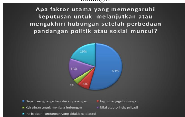
Gambar 4. Faktor Utama Dalam Memengaruhi Keputusan Untuk Melanjutkan Maupun Mengakhiri Hubungan

Lalu, 54% responden juga menyatakan bahwa menghargai keputusan pasangan terkait suatu pandangan politik maupun isu sosial menjadi lebih penting dan menjadi faktor utama dalam memengaruhi keputusan untuk melanjutkan maupun mengakhiri hubungan ketika konflik muncul. Hal ini sesuai dengan teori penetrasi sosial, di mana saling menghormati nilai dan opini memungkinkan proses self-disclosure tetap berjalan tanpa memicu depenetrasi.