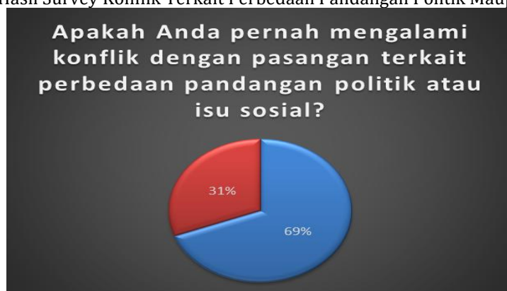
Gambar 2. Hasil Survey Konflik Terkait Perbedaan Pandangan Politik maupun Isu Sosial

Akan tetapi, berdasarkan pra-survey yang dilakukan oleh peneliti kepada 26 responden, dapat terlihat bahwa 69% responden menyatakan tidak pernah mengalami konflik dengan pasangan terkait perbedaan pandangan politik maupun isu sosial. Hal ini menunjukkan bahwa perbedaan sikap politik walaupun termasuk ke dalam tahap penetrasi sosial, tetapi tidak berdampak langsung tentang hubungan antar pasangan. Banyak pasangan kemungkinan memiliki toleransi tinggi terhadap perbedaan nilai atau sikap politik karena hal ini.